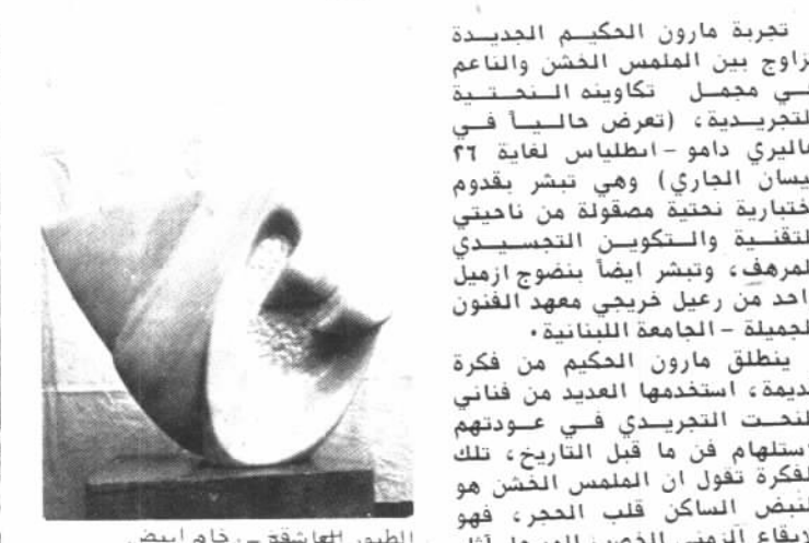
الطور للهاقة - رخام ابيض

يشوع، يستلمه مبريات تصور الجبل، ليعبر عن منطق الطاقة الخفية لاشراة، او كما يسمى بالطاقة عبر المبرية، فيمض استخدام الطاقة الزلزالية في الحرب، والفتاخر التجريدي في اكثر من عاصمة عالمية يعكس اصدا مظاهر الطاقة غير المرئية على الانسانية، فالطاقة القوة الكويبية التي تسكن عواطف وكهر وبت وهي هاجس اكتشافات انسان هذا العصر، والطاقة غير المرئية هي محور اهتمام، لان